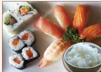
Sushi piccolo + riso bianco