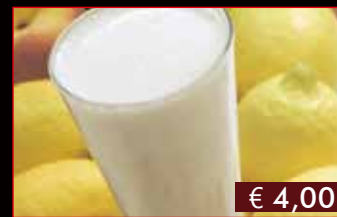
192. Sorbetto limone € 4,00