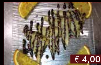
194. Nutella fritto 4 pz € 4,00