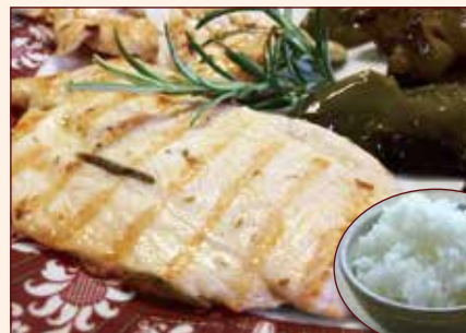
Pollo alla griglia + riso bianco