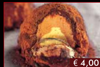
176. Tartufo nero € 4,00