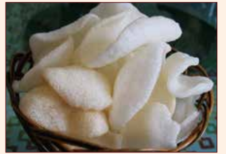
NUVOLE DI GAMBERI