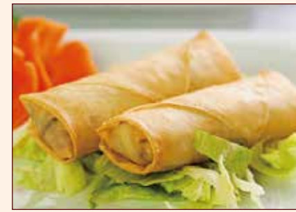
HARUMAKI involtni giapponesi con gamberi e verdure 2pz