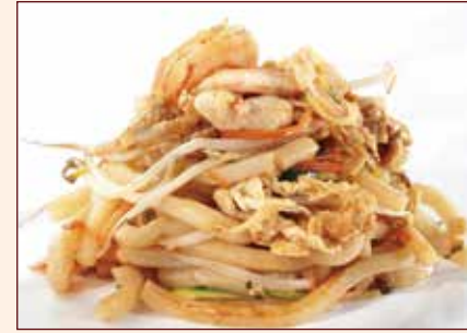
Udon saltato con verdure e gamberi