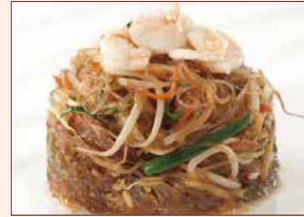
Spaghetti di soia saltato con verdure e gamberi