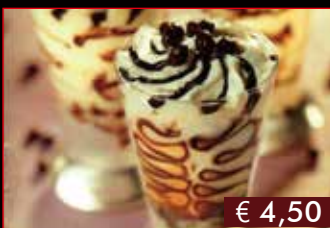
190. Coppa caffè € 4,50