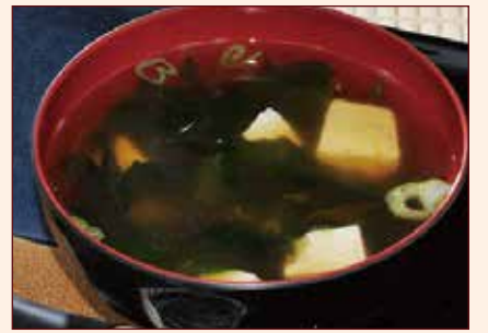
ZUPPA zuppa di soia con alghe e tofu