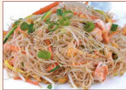
Spaghetti di riso saltato con verdure e gamberi