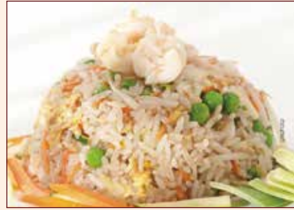
Riso saltato con verdure e gamberi