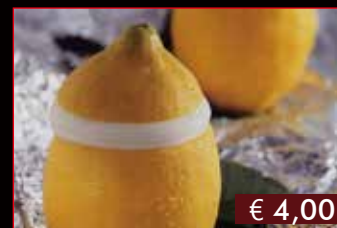
188. Limone ripieno € 4,00