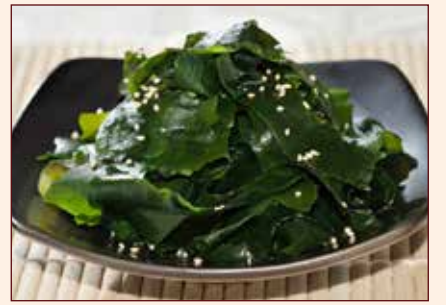
WAKAME alghe giapponesi