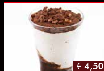
191. Coppa cacao € 4,50