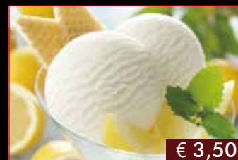
181. Gelato tè verde € 3,50