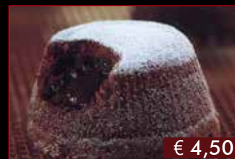
189. Soufflè di cioccolato € 4,50