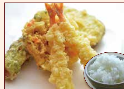
Tempura mista + riso bianco