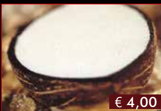
187. Cocco ripieno € 4,00