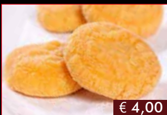
174. Dolce di zucca € 4,00