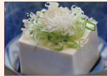
TOU FU CRUDO tou fu crudo con salsa di soia