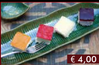
193. Sushi dessert € 4,00 meringa con gelatina alla frutta