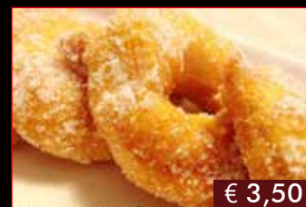
173. Tempura di mele € 3,50