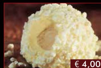
175. Tartufo bianco € 4,00