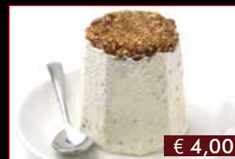
186. Torroncino € 4,00