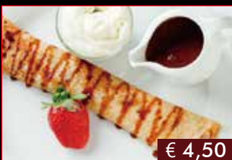
177. Crep di cioccolato € 4,50